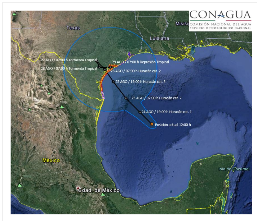
Trayectoria pronóstico del Huracán "HARVEY"